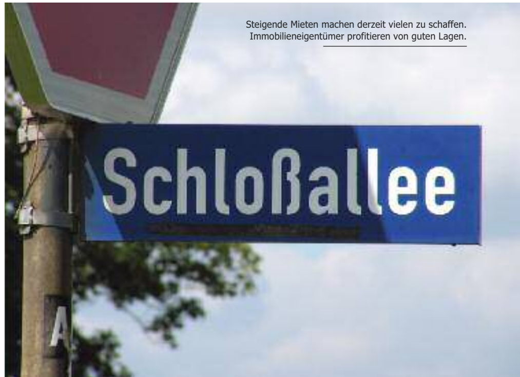
Steigende Mieten machen derzeit vielen zu schaffen. Immobilieneigentümer profitieren von guten Lagen.

Wofür aber zahlt Hans diese hohe Miete? Sind die Häuser in Hamburg oder München stabiler und besser gebaut oder haben sie eine bessere Ausstattung? Mitnichten. Sind die Ziegelsteine, der Mörtel, die Stahlträger oder die Bauarbeiter in München und Hamburg so viel teurer als in Gelsenkirchen oder Salzgitter? Wäre dies der Fall, würde man sich beim