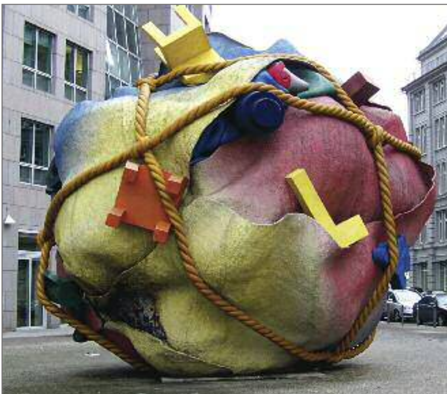
»houseball« – Skulptur von Claes Oldenburg und Coosje van Bruggen als Symbol für das Leid von Flüchtlingen. Flucht ist auch eine Folge des Landgrabbing und der Konflikte um den Boden

Das Modell einer Bodenreform entsprechend den Gedanken von Gesell sah demgegenüber völlig anders aus. Das Privateigentum an Boden sollte nach und nach auf friedlichem Wege und mit angemessener Entschädigung der Bodeneigentümer in öffentliches Eigentum überführt werden, indem anstelle der Bodenrente eine Entschädigung auf Raten vom Staat an die Eigentümer gezahlt werden sollte. Der Staat (zum Beispiel in Form der Gemeinde) sollte den Boden dann verpachten, damit er auch individuell oder von Genossenschaften gegen Zahlung einer angemessenen Pacht bewirtschaftet werden konnte. Die Pachtzinsen fließen nach diesem Modell nicht mehr privaten Bodeneigentümern zu, sondern dem Staat der daraus die Entschädigungsraten finanzieren kann; und der Bo-