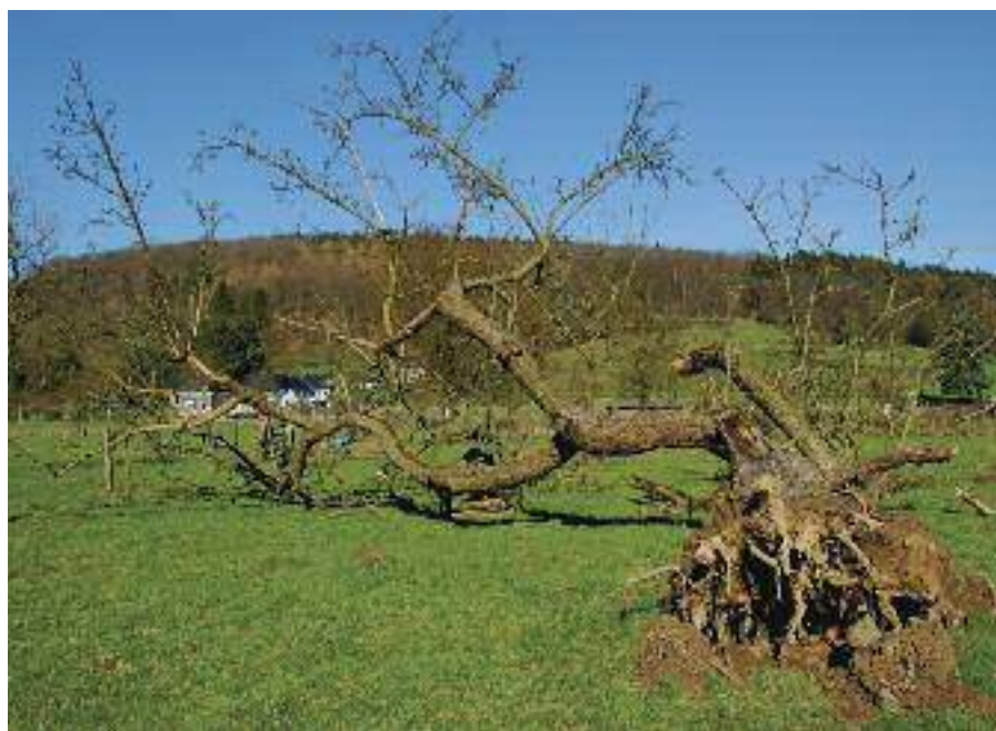
Den Bezug zur Lebensgrundlage – wer hat ihn noch?

Dabei geht es natürlich nicht um das »Abschneiden eines Grundstücks«, sondern letztlich um die in der Geschichte ursprünglich mit