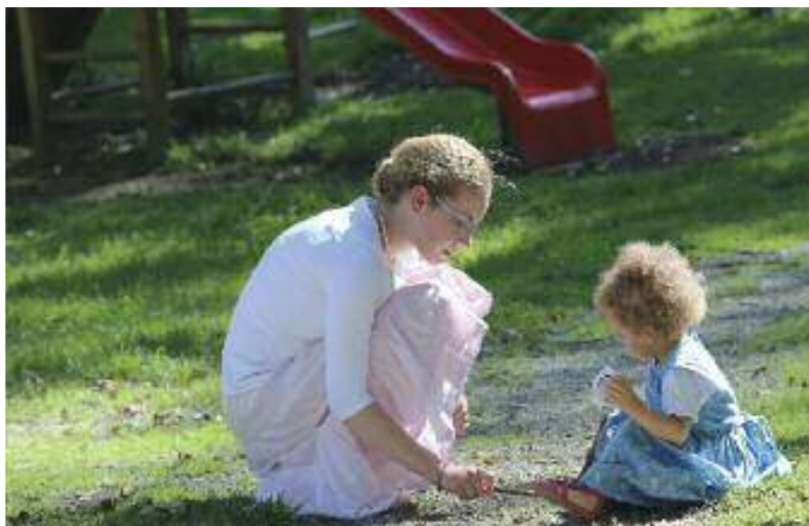
Man könnte die Bodenrenten an die erziehenden Mütter und Väter auszahlen oder daraus ein Grund- einkommen finanzieren, um so jedem Bürger den Zugang zu den daseinsnotwendigen öffentlichen Gü- tern zu ermöglichen.

Abbildung 1 hat auch verteilungspolitische Folgen: Ohne Eigenkapital gibt es keinen Zugang zu »Land« i.w.S., und damit keinen Zugang zu Renten und Gewinnen. Hierzu ein Beispiel (S. 136 f.): Das Verhältnis von Im- mobilienpreisen zu Einkommen (price-inco- me-ratio) liegt in Deutschland nur bei rund