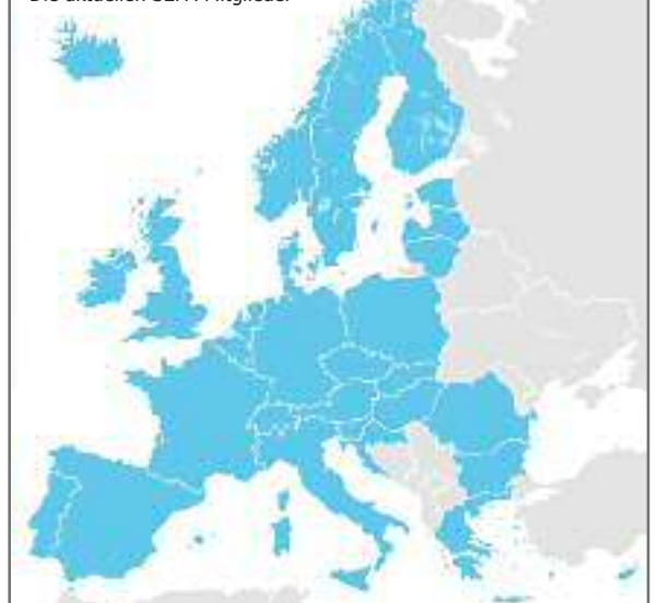
Die aktuellen SEPA-Mitglieder