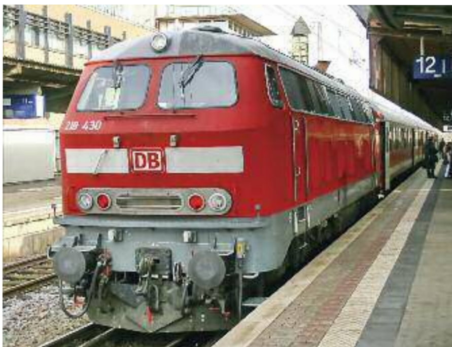
Würden die Bodenrenten vergemeinschaftet, könnte zum Beispiel das Bahnfahren günstiger werden, denn die Kosten der Infrastruktur könnten aus den Bodenrenten abgedeckt werden.

Die Steuer geht also am Ende zu Lasten der Renten (»all tax comes out of rent«).